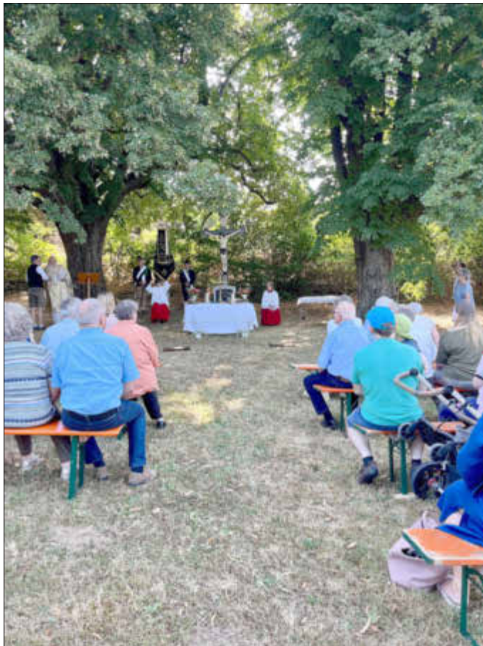
Der Gottesdienst am Brindler Kreuz.

Am Sonntag, den 24. Juli 2022 lud der Schützenverein Eichenlaub Unterstall zu seinem traditionellen Grillfest ein, welches nach zwei Jahren corona-bedingter Zwangspause nun endlich wieder stattfinden konnte. Zu Beginn fand die Sonntagsmesse im Freien, am Brindler Kreuz, statt. Musikalisch wurde diese, wie auch das Grillfest, von der Unterstaller „Maibaummusi“ umrahmt. Nach dem Gottesdienst waren alle Gäste in den Biergarten der Schützengaststätte „La Pergola“ eingeladen. Dort wurden sie mit Spanferkel vom Grill, Steckerlfisch und einer großen Kuchenauswahl verköstigt. Im Anschluss daran fand die Preisverteilung des Bürgerschießens statt. Insgesamt gingen dieses Jahr 104 Schützen und Schützinnen an den Start. Elf Mannschaften traten an, wobei sich die Mannschaft der „Holzgasse“ den Preis für die Meistbeteiligung sicherte. Die Mannschaft „Bürgergemeinschaft“ gewann mit 475,3 Ringen den Wanderpokal.