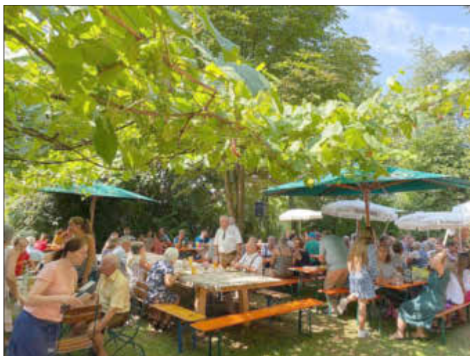
Das Grillfest im Biergarten der Schützengaststätte „La Pergola“.