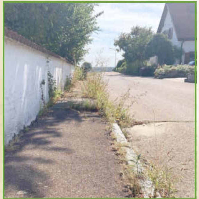
Wenige Beispiele von vielen!