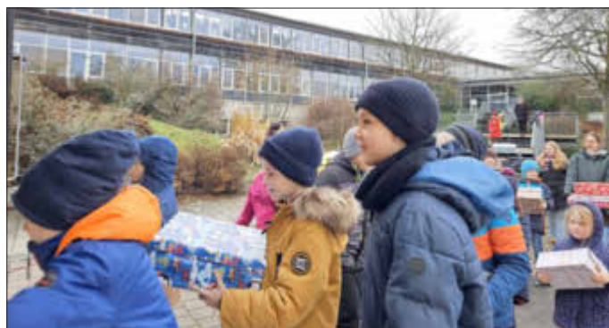
Text: Zillner